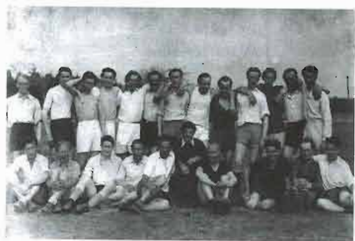
1948 – přátelské utkání Pila – Olšová Vrata