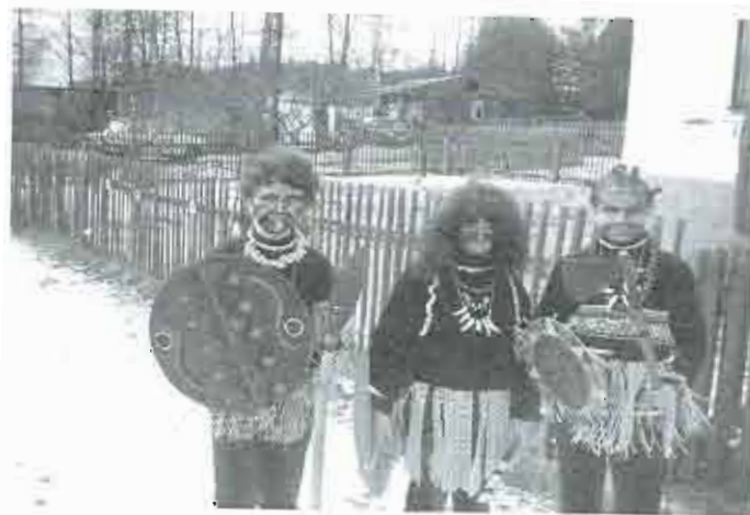
2001 - masopust