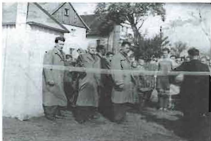
1960 – slavnostní otevření nového (nynějšiho) hřiště