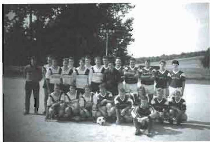
1992 – zájezd do Německa

Žáci pak ukončili své účinkování v okresním přeboru. Bylo třeba počkat na novou krev.