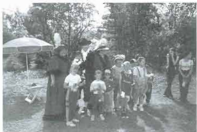
2002 – Den dětí