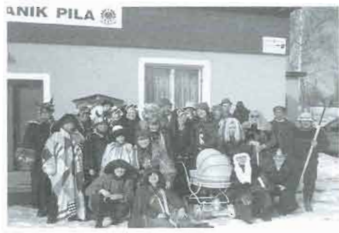
2003 - masopust