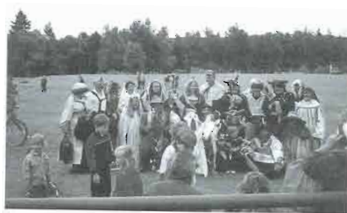
1999 – Den dětí