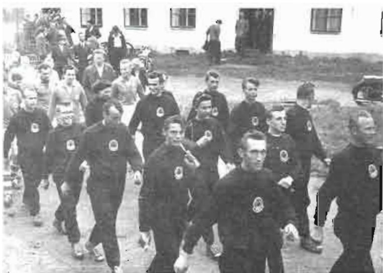
1954 – okrsková spartakiáda v Pile