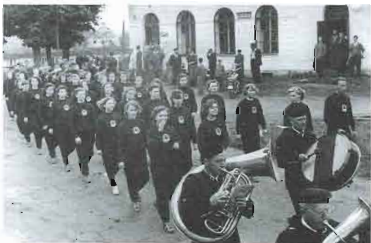
1954 – okrsková spartakiáda v Pile

V předchozích kapitolách sborníku bylo o podnicích oddílu hovořeno jako o mužské záležitosti. Zároveň byly okrajově zmiňovány další aktivity klubu. A ty jsou přitom spjaty především s ženskou částí členské základny. Na tomto místě tedy připojujeme vedle poděkování i několik fotografií z akcí, které by bez zájmu, nápadů a pracovitosti našich žen jen těžko vznikaly. Za všechny jmenujme pravidelně organizované dětské dny, mikulášské a maškarní veselice pro nejmenší, v kraji vyhlášené masopustní průvody, či tradiční pálení čarodějnic. Nelze opomenout ani velikonoční zábavy nebo, v životě venkovském nezvyklé, sváteční vánoční koncerty. Z podniků sportovních vzpomeňme na každoročně pořádané vánoční turnaje ve stolním tenisu.