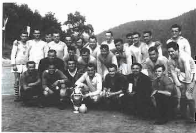
Turnaj ve Stanovicích – s pohárem O. Ozom (nedatováno)